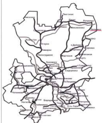
СХЕМА ГРАДОСТРОИТЕЛЬНОГО ЗОНИРОВАНИЯ СЕЛА ЛИТКОВКА ЛИТКОВСКОГО СЕЛЬСКОГО ПОСЕЛЕНИЯ ТАРСКОГО МУНИЦИПАЛЬНОГО РАЙОНА ОМСКОЙ ОБЛАСТИ

УТВЕРЖДЕНО Решением Совета Литковского сельского поселения № 37 от 23.08.2008, Председатель Совета Литковского сельского поселения, Тарского муниципального района Омской области