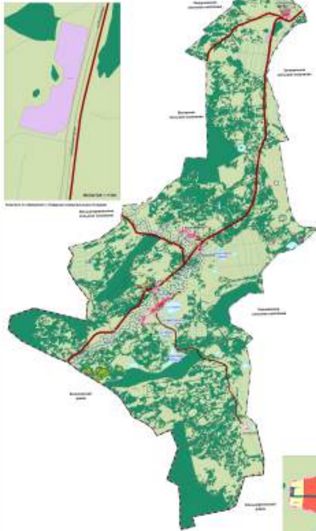
Карта градостроительного зонирования