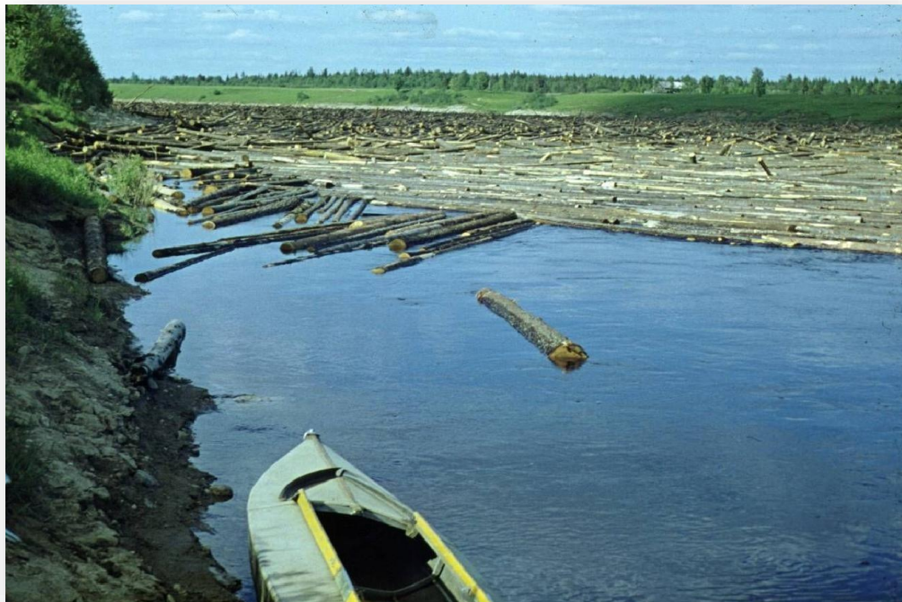
Изображение - 6 Спеленный ствол дерева в воде «Плавник» с признаками рубки не является валежником