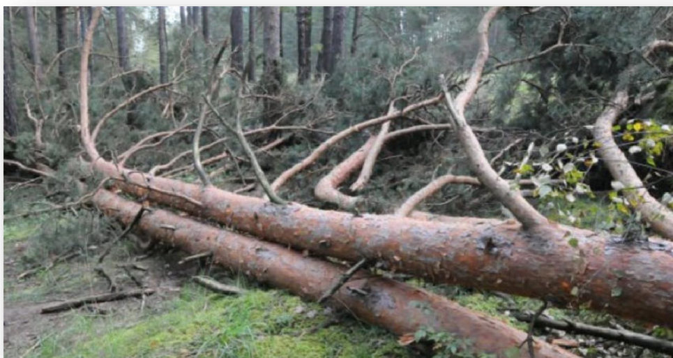
Изображение 3 - Лежащее на поверхности земли ветровальное дерево, не имеющее признаков отмирания. Не является валежником