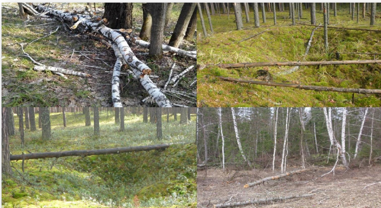
Изображение 1 - Валежник