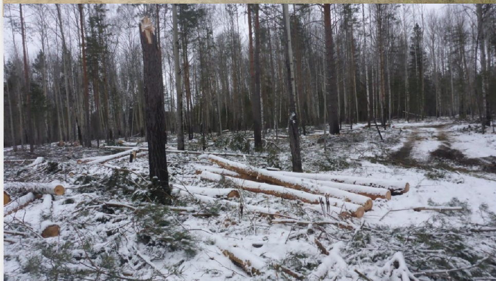
Изображение 4 - Заготовленная древесина на лесосеке. Не является валежником