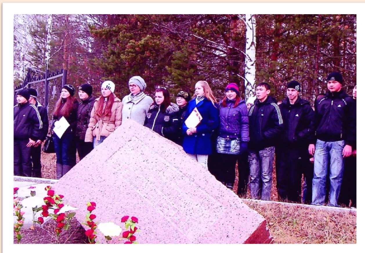
Участники митинга у памятного знака жертвам политических репрессий в г.Таре 30 октября 2010 г.

Уже давно 30 октября стал всенародным днем памяти, днем народного траура. В этот день вспоминают миллионы людей, которые были необоснованно подвергнуты репрессиям, отправлены в исправительно-трудовые лагеря, в ссылку, лишены жизни в годы сталинского террора и после него.